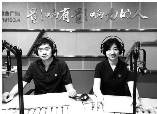
社科专家参加常州广播电台 “社科百家谈”访谈

社会科学界是党的意识形态工作的前沿阵地，肩负着巩固壮大主流思想舆论的重大政治责任。常州市社科联下属学会105家、社科科普基地72个，社科工作者数万人，他们知识丰富、思想活跃，影响面大，喜好发表观点，但规矩意识不强，政治敏感性不够，给做好意识形态工作带来挑战。常州市社科联根据意识形态工作新形势、新要求，主动切入全市宣传思想文化工作大局，进一步前移关口、压实责任，创新思路，立价值导向，破思想迷惑，立管理规矩，破自由散漫，立先进典型，破发展短板，不断增强意识形态工作引领力、掌控力和凝聚力，切实将阵地管理权、话语权牢牢抓在手里，开创了社科领域意识形态工作新局面。“三立三破，构建意识形态工作新格局”的做法，被常州市委宣传部评为全市宣传思想文化系统工作创新奖。