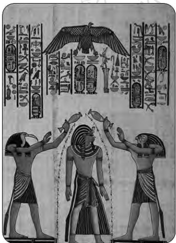
鹰神荷鲁斯为拉美西斯二世沐浴祈福

安详的尼罗河有时也会“发怒”。每年六月份尼罗河开始涨水，到了九月份达到最大流量，对没有现代水利工程的古埃及人来说，这样周而复始的洪水就是一场灾难。洪水过后，肥沃的土地渐渐从水下露出来，界碑早就被冲得不见踪影，为了解决土地丈量问题，高超的几何学和测量学在古埃及的奴隶主阶层中诞生了。