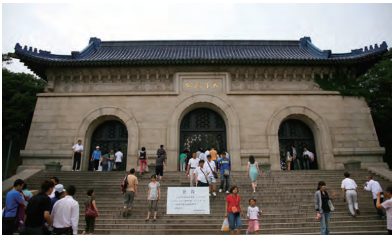
南京中山陵门额上题写着“天下为公”四个大字

从古代到近代，“小康”与“大同”被中国人视为理想的社会状态或理想社会。“大同”是夜不闭户、路不拾遗、天下为公的理想社会，“小康”则是君臣有义、长幼有序、天下为家的礼法社会。到“小康”、到“大同”，是社会发展的方向，需要人们长期不懈地奋斗和努力。