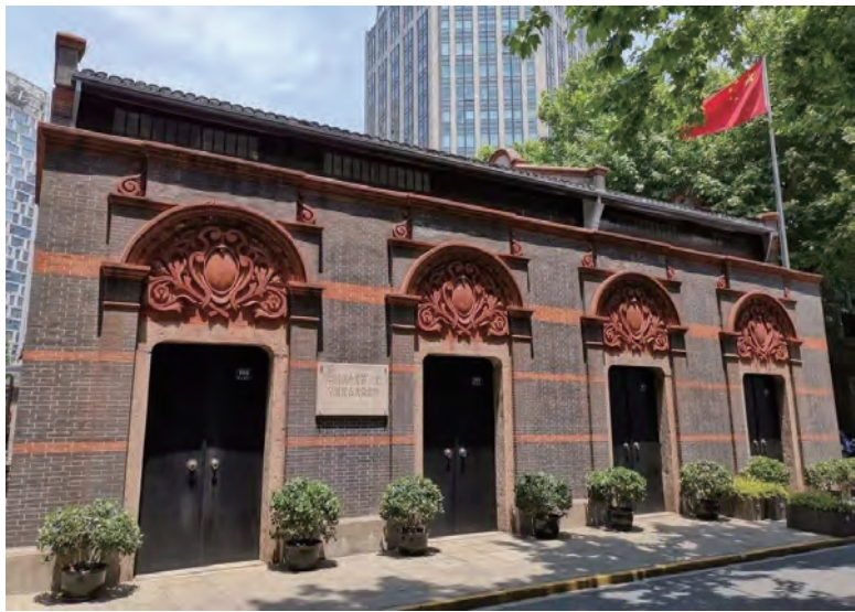
中国共产党第一次全国代表大会会址