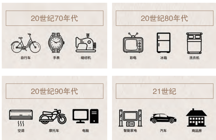
不同时代的结婚“三大件”

到社会面貌，从文化建设到日常生活，老百姓的生活发生了翻天覆地的变化。经济社会发展带来了城乡居民收入大提升，也加快了消费结构的升级换代，由改革开放初期的“自行车、手表、缝纫机”“彩电、冰箱、洗衣机”，之后的“空调、摩托车、电脑”，发展到现在的“智能家电、汽车、商品房”。城乡居民居住条件大幅度改善，从“蜗居”走向“广厦”，出行方式从“自行车、公共汽车、绿皮火车”变成“小汽车、地铁轻轨、高铁飞机”。“小康生活”日渐丰富饱满地存在于老百姓的日常生活中。